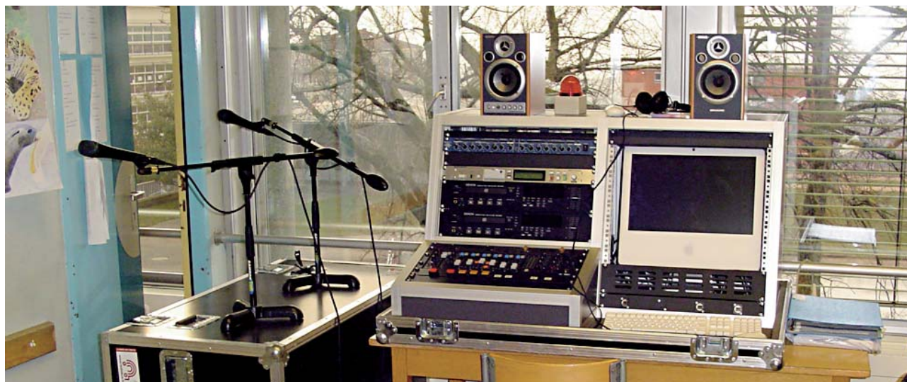
Une RadioBox est prêtée aux classes qui s'engagent à produire une émission hebdomadaire ou bi-hebdomadaire

Du point de vue des élèves, l'année a passé trop vite!