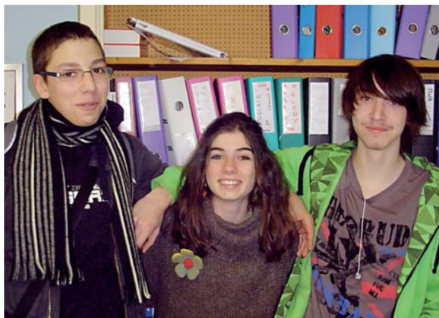
Parler au micro, c'est génial!