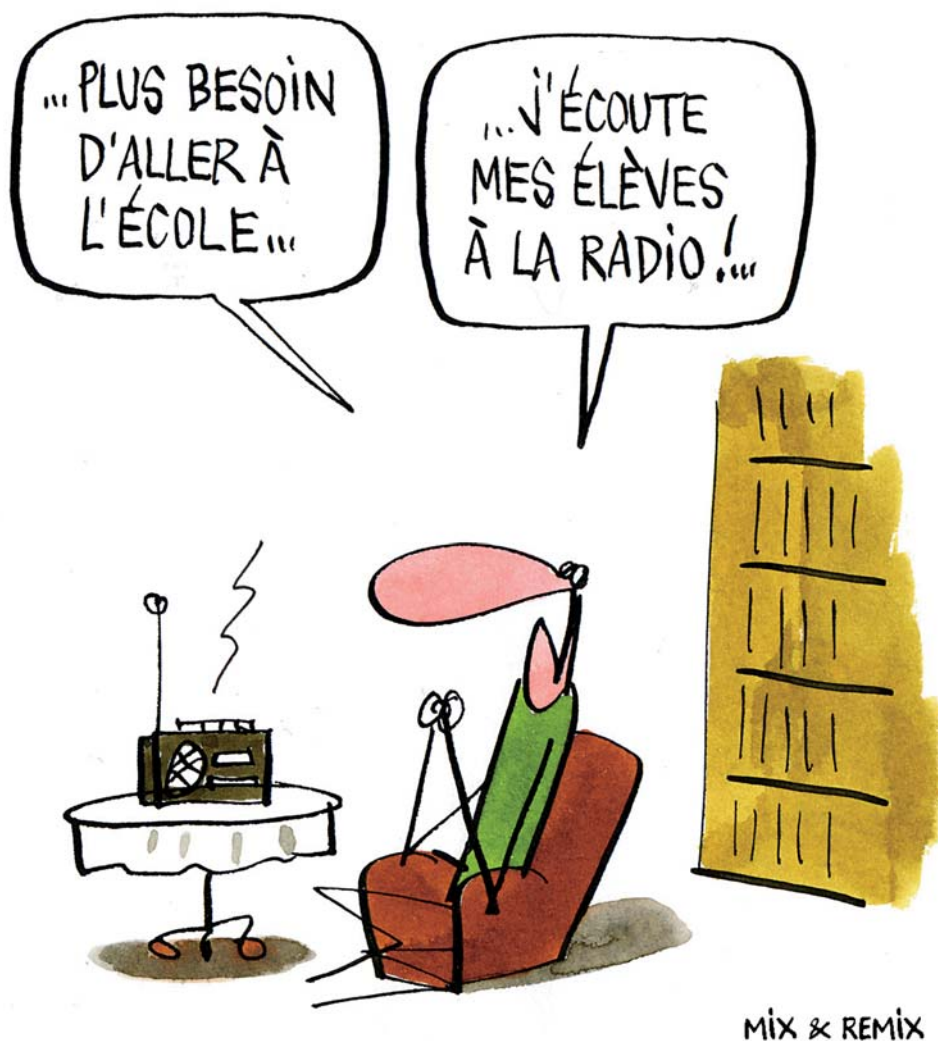
MIX & REMIX

arrivaient au cours en ayant déjà tout préparé «chez eux» (rédactions de chronique, choix musical, etc.).