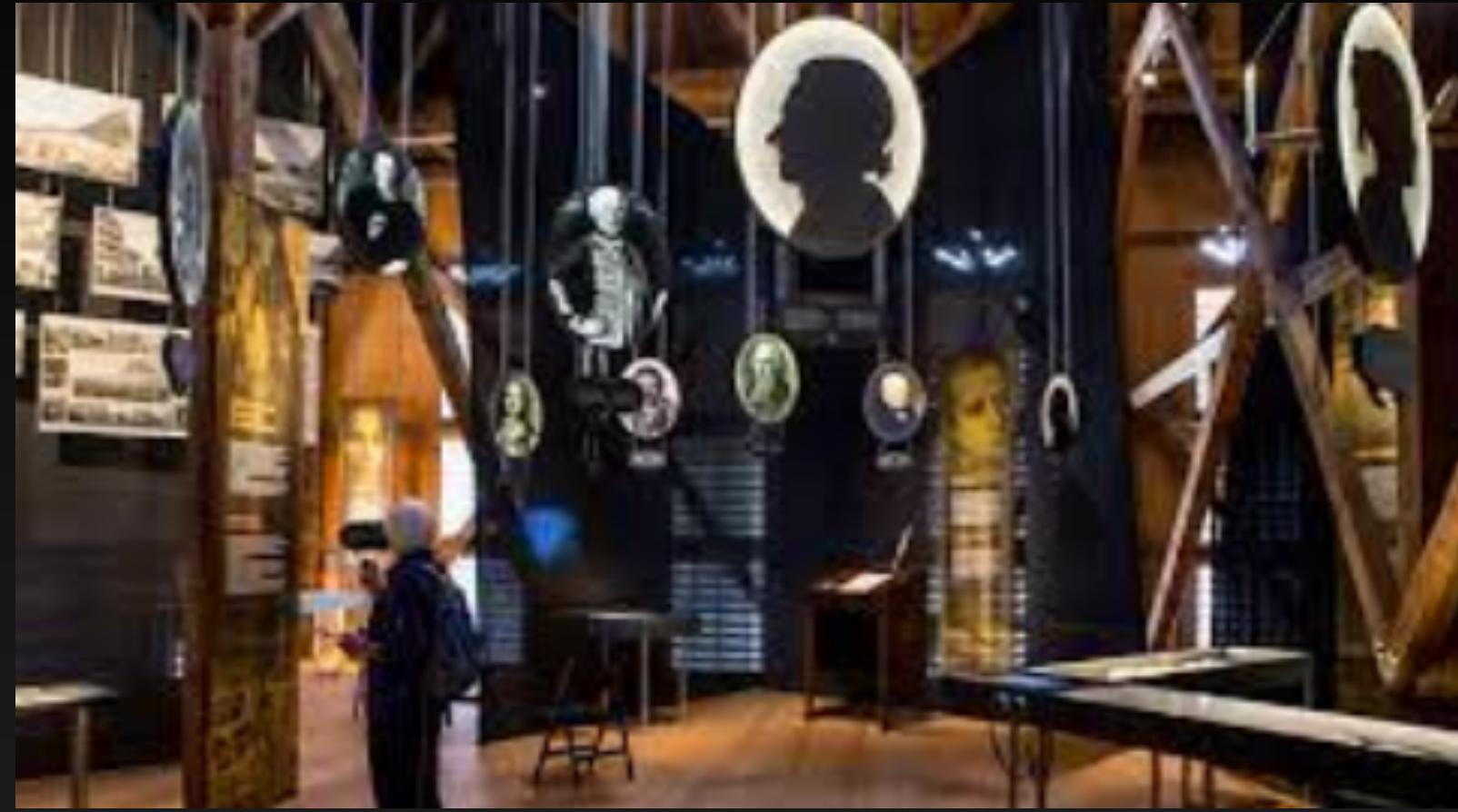
Anna Göldi Museum