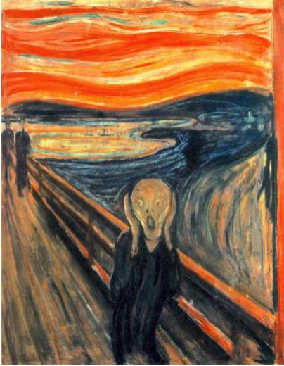
Le cri de Munch (1883)

Voici les célèbres peintures que je te propose. Choisis-en une et départ pour te déguiser, poser, mimer une expression...Tu peux faire cette activité avec ta famille ! Amuse-toi bien 😊