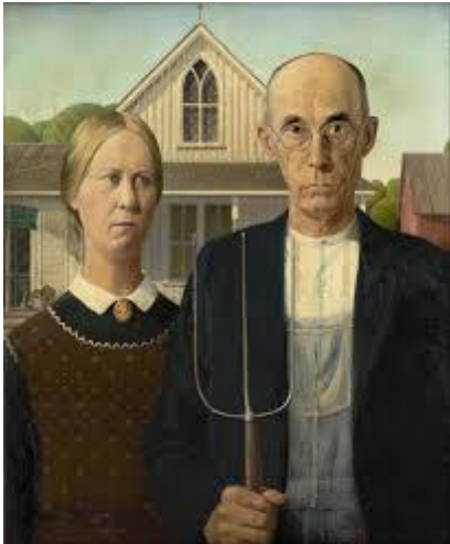
American Gothic de Grant Wood (1930)