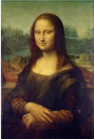
La Joconde (Mona Lisa) de Leonard de Vinci (1503-1506)