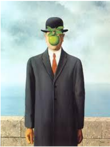
Le fils de l'homme de René Magritte (1964)