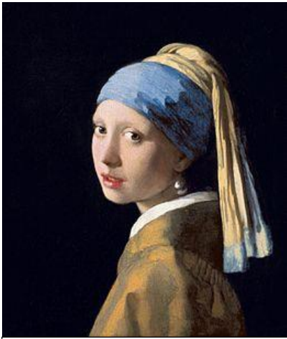
La jeune fille à la perle de Johannes Vermeer (1665)